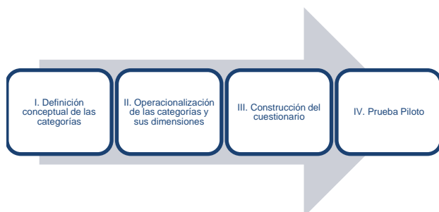
Figura 1. Metodología para la construcción del cuestionario.

La metodología utilizada para la construcción del cuestionario se integró por cuatro etapas, como se ilustra en la Figura 1 y se describe a continuación.